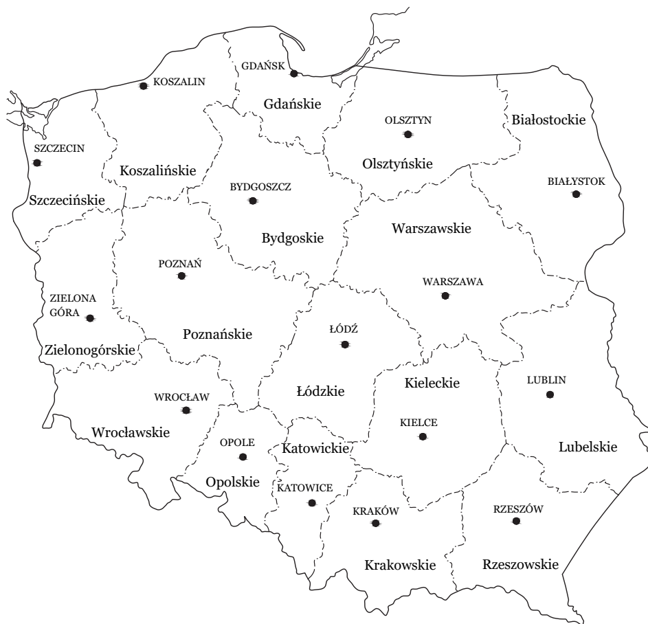
Województwo Poznańskie w latach 1950-1975 na tle podziału terytorialnego kraju.