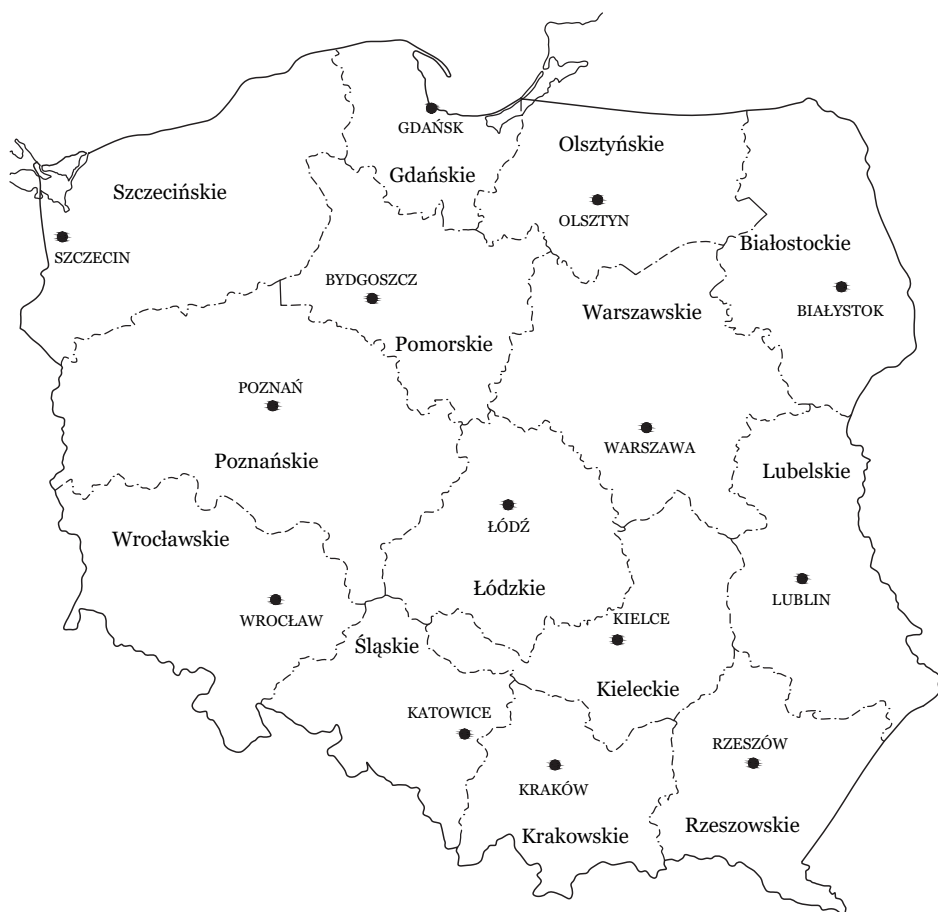
Województwo Poznańskie w latach 1945-1950 na tle podziału terytorialnego kraju.