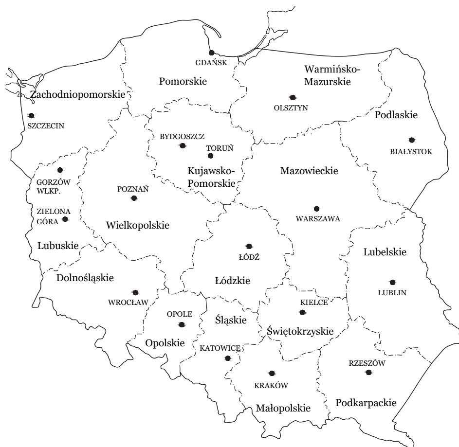
Województwo Wielkopolskie od 1999 na tle podziału terytorialnego kraju.