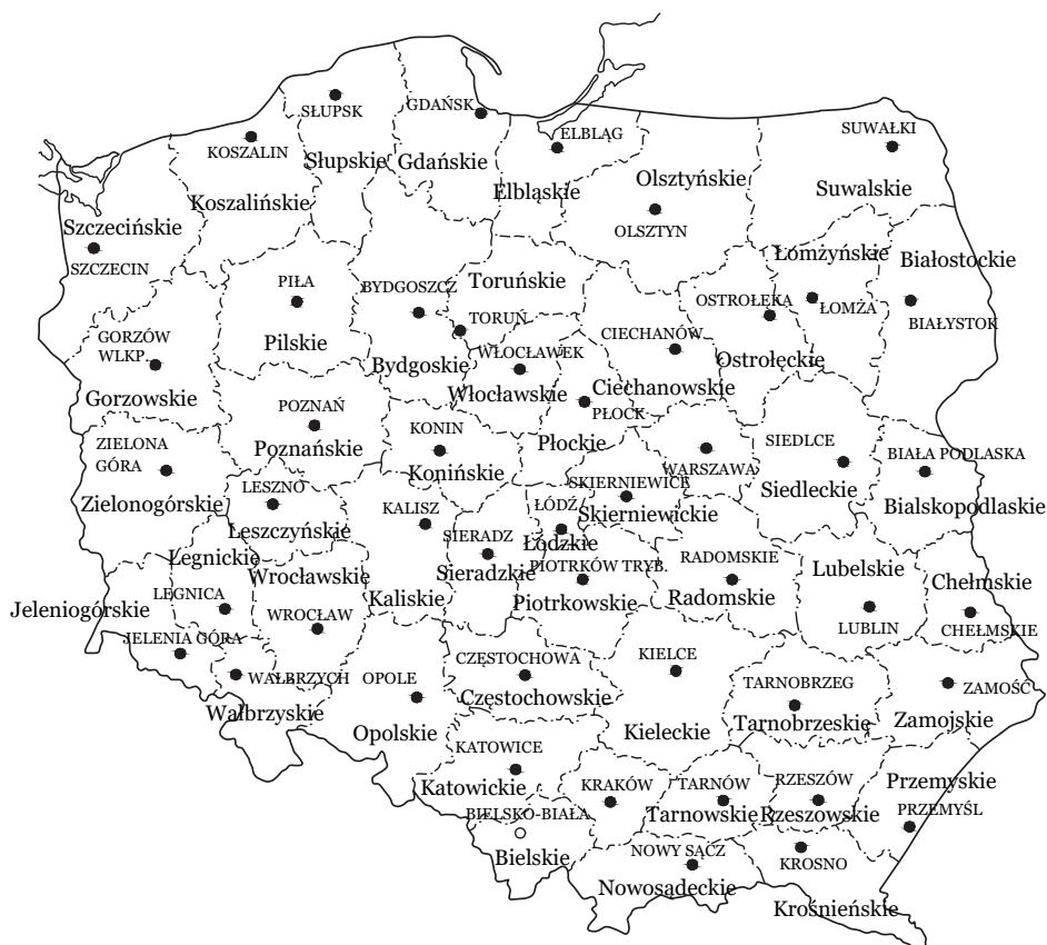
Województwo Poznańskie w latach 1975-1998 na tle podziału terytorialnego kraju.